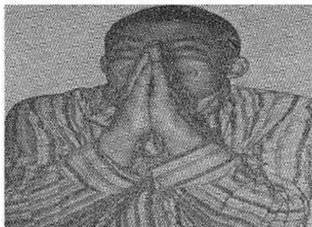
Surat №2. Şizofreniýanyň gebefreniki görnüşinde.