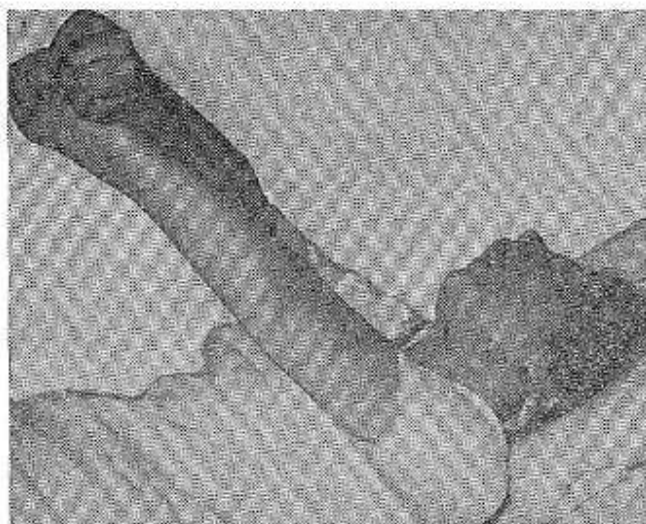
Surat №1. Näsag epileptiki tutgaýda.