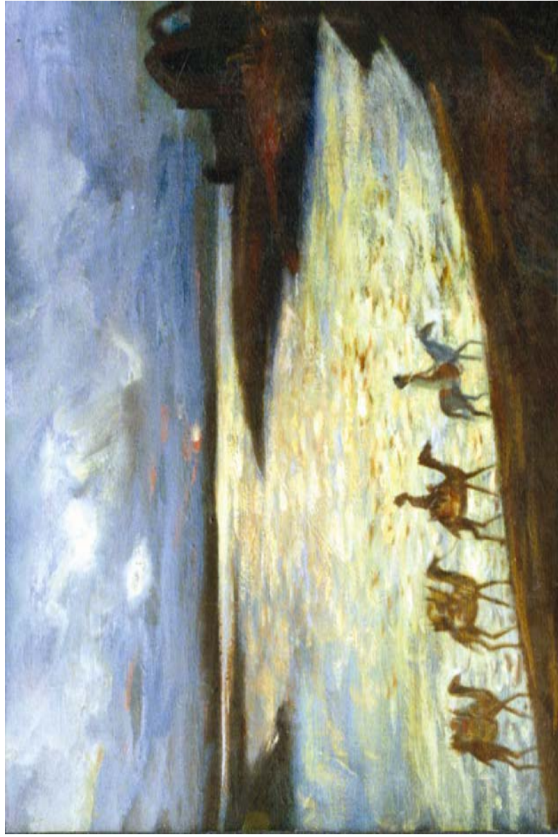
Uzak ýoldan. Kämil Weliakhmedowyň çeken suraty.