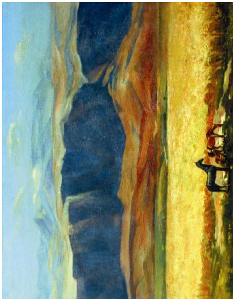
Mähriban ýurdum. Kämil Weliähmedowyň çeken suraty.