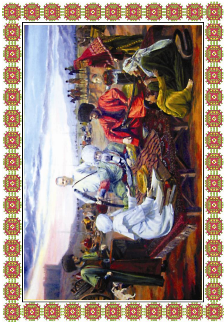
Öňünden görüji Ýakub Halmyradowyň çeken suraty