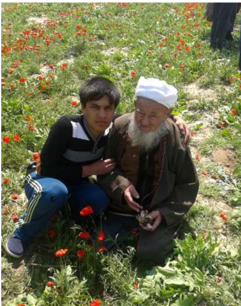
Kakajan molla Ýeroýlan duzda.