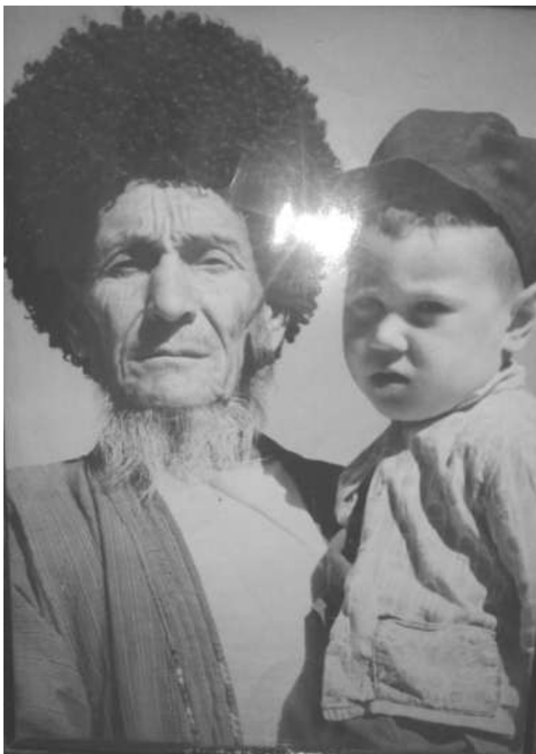
Çoluk aga agtygy bilen.