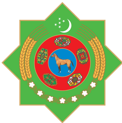
TÜRKMENISTANYŇ DÖWLET TUGRASY