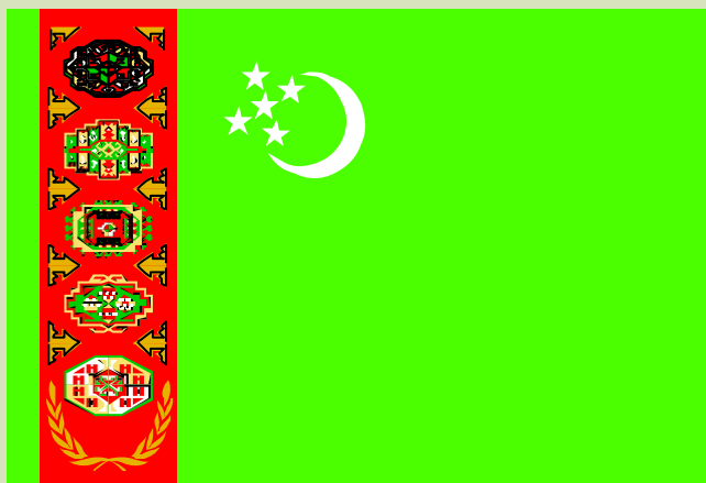
TÜRKMENISTANYŇ DÖWLET BAÝDAGY