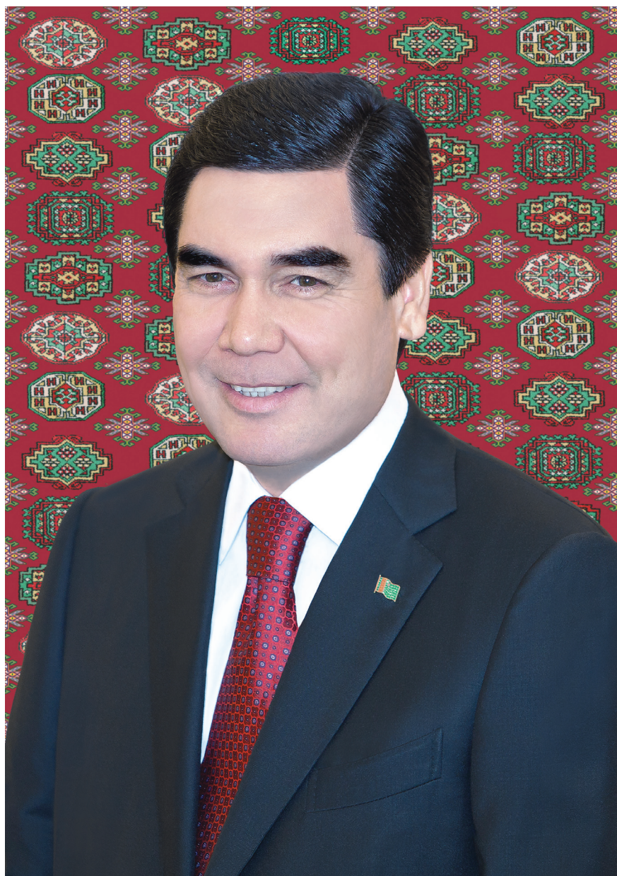
TÜRKMENISTANYŇ PREZIDENTI GURBANGULY BERDIMUHAMEDOW